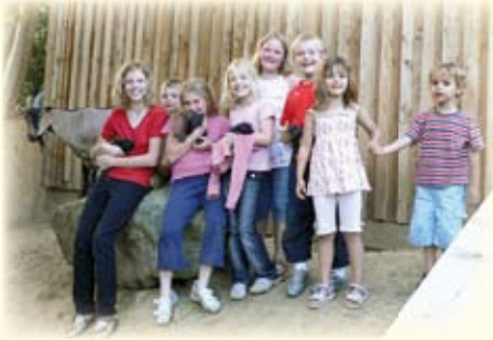
Kleine Tierfreunde finden schnell Ihren Liebling!