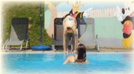
Baden im hauseigenen beheizten Schwimmbad bei ca. 25 Grad unter freiem Himmel.