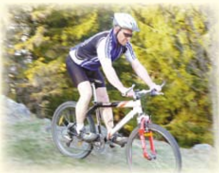
Mountainbiken direkt an der Alpentour.