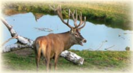
Rothirsche im Wildgehege.