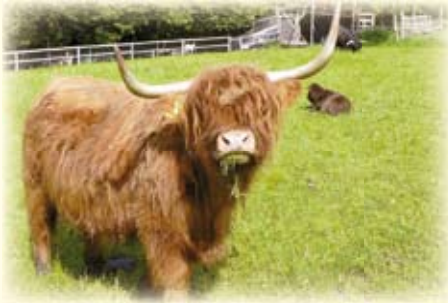
Hochlandrinderkuh Mia lässt sich's schmecken.