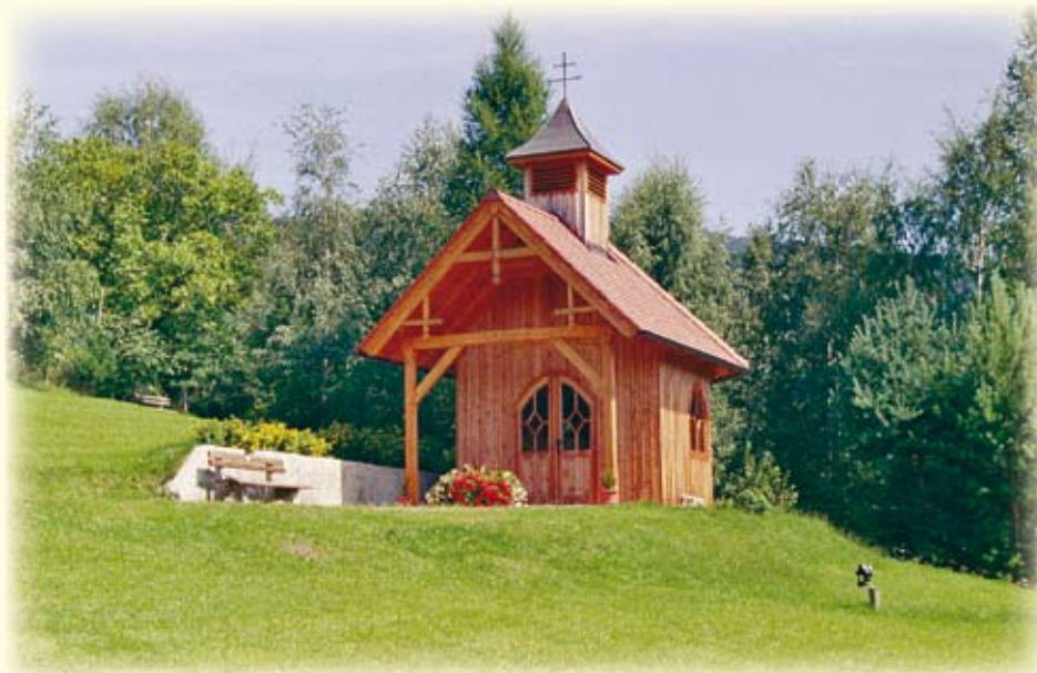
Waldhofkapelle - der Ort zur Einkehr und Besinnung.

Hotelgäste genießen den wöchentlichen Grillabend auf unserer Hirschalmhütte bei herrlichem Panorama und einem guten Tröpferl.