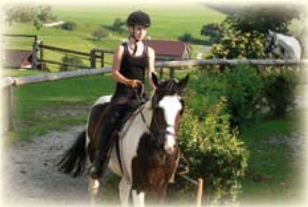
Ausritte & Reitstunden direkt am Hof.