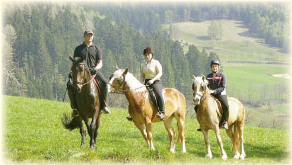
Für Anfänger oder unerfahrene Reiter gibt es Unterrichtseinheiten am neuen Viereck(20x40m). Fortgeschrittene Reiter können jederzeit am gemeinsamen Ausritt teilnehmen. Traumhafte Galoppstrecken und schöne Wald- und Wiesenwege lassen die Reiterherzen höher schlagen.