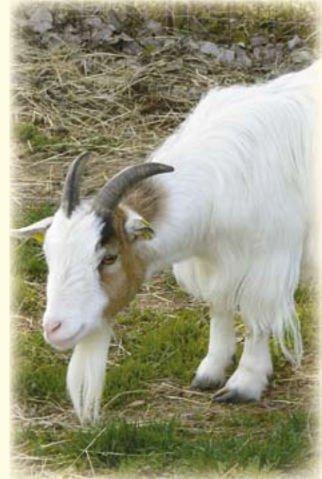
Ziegenbock „Mecky“ freut sich immer auf neue Freunde!