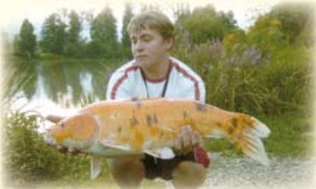
Fischmöglichkeit im Ort.