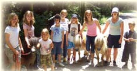
Unsere Minipferde haben immer Lust auf einen gemeinsamen Sparziergang mit Dir!